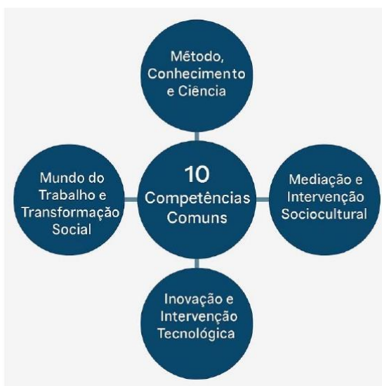
Parâmetros Nacionais - Itinerários Formativos de

Assim, para o Ensino Médio Técnico e Profissional, considerando o preposto, orienta-se a sistematização dos Eixos Estruturantes “Mundo do Trabalho e Transformação Social” e “Inovação e Intervenção Tecnológica”, organizada pela distribuição de Atribuições Empreendedoras aplicadas às nomenclaturas funcionais de Planejamento, Execução e Controle, bem como às Áreas de Ação Empreendedora de Análise e Planejamento, Ações Comportamentais e Atitudinais, Liderança, Integração Social, Criatividade e Inovação, estruturadas e em alinhamento direto com as Dez Competências Gerais dos Itinerários Formativos, como segue: